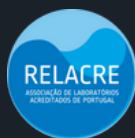
Certificação Relacre Formação END

O IEP é uma entidade formadora certificada pela DGERT e pela APCER. Conheça todos os nossos reconhecimentos: